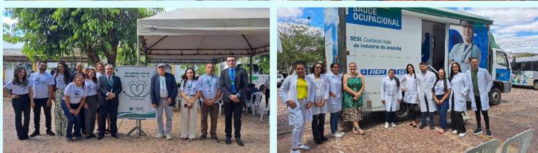
Praça Marcos Aurélio recebeu muitos populares para os atendimentos com os parceiros: Sec. Mun. de Saúde de Bom Jesus, Defensoria Pública do PI, Instituto de Identificação, Senac e FIEP-Sesi

Foi um sucesso o 2º CRM Itinerante, realizado no último dia 30 de agosto, no município de Bom Jesus, a quase 700 km de Teresina. Várias atividades, como é a proposta de itinerância do CRM Piauí, foram realizadas, tanto para médicos, como para a população, como forma de descentralizar mais as ações do Conselho, levando prestação de serviços e cidadania de forma gratuita para vários municípios.