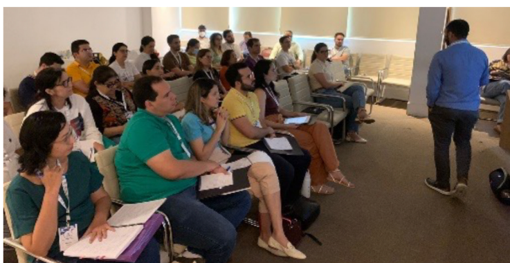
Turma encerrando o curso FCCS e médicos na aula da capacitação PALS

Dois cursos movimentaram os médicos pelo Programa de Educação Médica Continuada do CRM-PI neste mês de abril. O primeiro foi a Capacitação em Fundamentos em Terapia Intensiva (FCCS), que aconteceu nos dias 06 e 07 de abril. O segundo foi a Capacitação em Suporte Avançado de Vida em Pediatria (PALS), nos dias 13 e 14 de abril, em Teresina. A capacitação PALS foi preferencialmente para pediatras que atuam na rede hospitalar, para médicos que atuam em setores de pediatria e ainda residentes na área. Nos dois cursos, participaram médicos da capital e de outros municípios, uma forma do Conselho levar atualização aos profissionais, de forma gratuita.