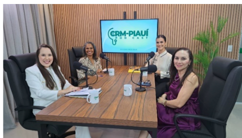
As convidadas do programa e a equipe de produção e edição