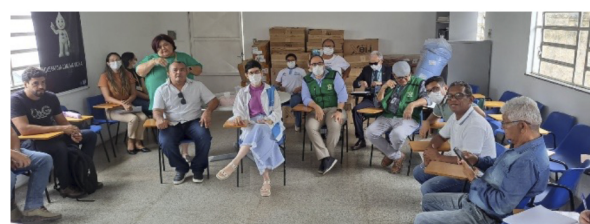
Reunião com diretoria, funcionários e moradores na UBS Piçarreira

Após denúncias de falta de estrutura física nas instalações de algumas Unidades Básicas de Saúde de Teresina, o CRM-PI realizou algumas fiscalizações. No dia 26 de fevereiro, foi realizada vistoria na UBS Piçarreira e outra na UBS Chico Ramos, no bairro Satélite. Constatou-se problemas de goteiras e mofo causados pelas chuvas, falta de alguns medicamentos e até problemas elétricos, devido à falta de manutenção da rede, como foi visto na UBS Piçarreira.