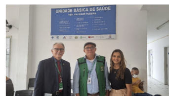
UBS Ver. Valdinar Pereira, Loteamento Mocambinho